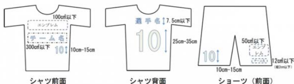
図1 <チーム識別標章(チーム名/エンブレム)及び選手番号のサイズ> (本規程 第5条 (1) 及び (2) )