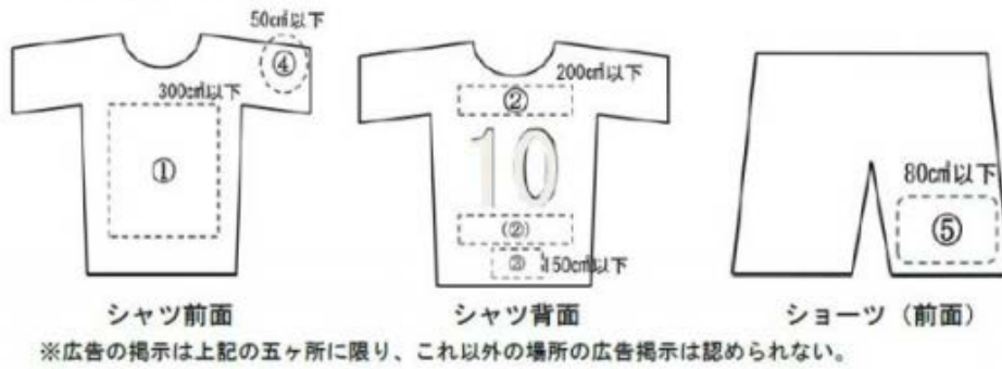
図4 <表示物及び掲示物のサイズの計算>